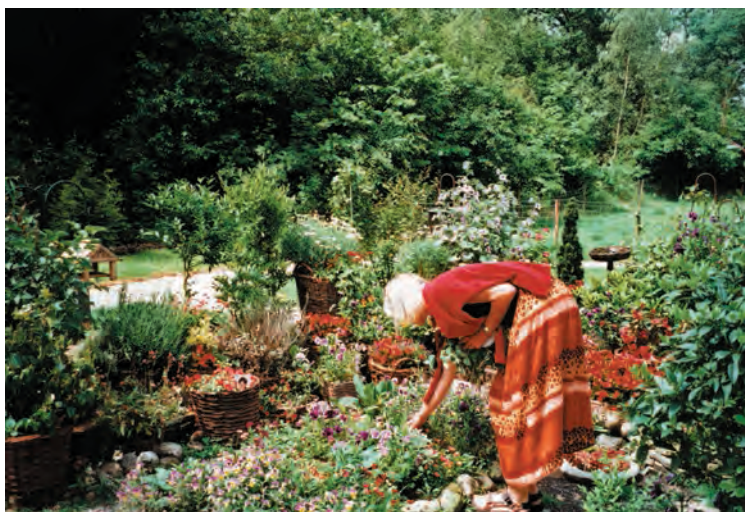
Willems tuintje zomer 2001 (blz. 102, 128)