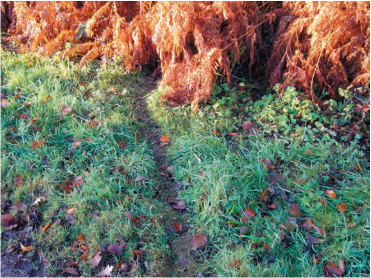
Wissel (blz. 167)