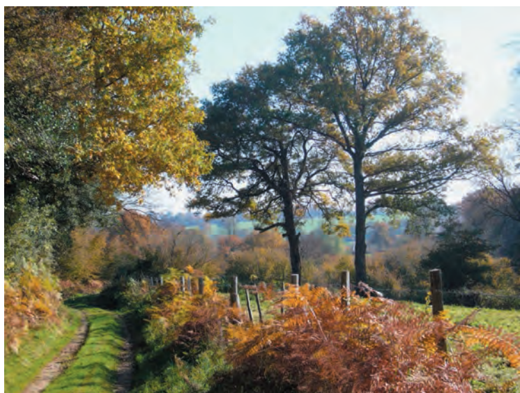
Herfstpracht, 5 november 2007 (blz. 37)