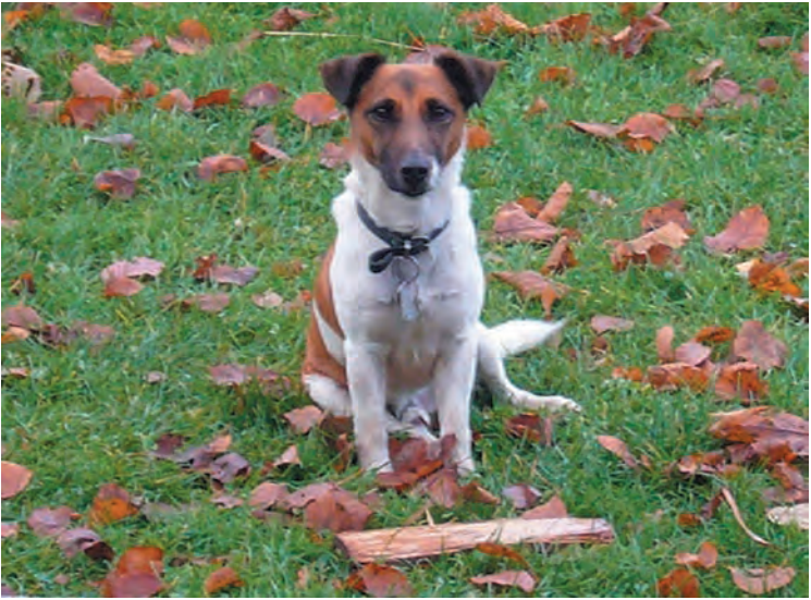
Dirk (blz. 13)