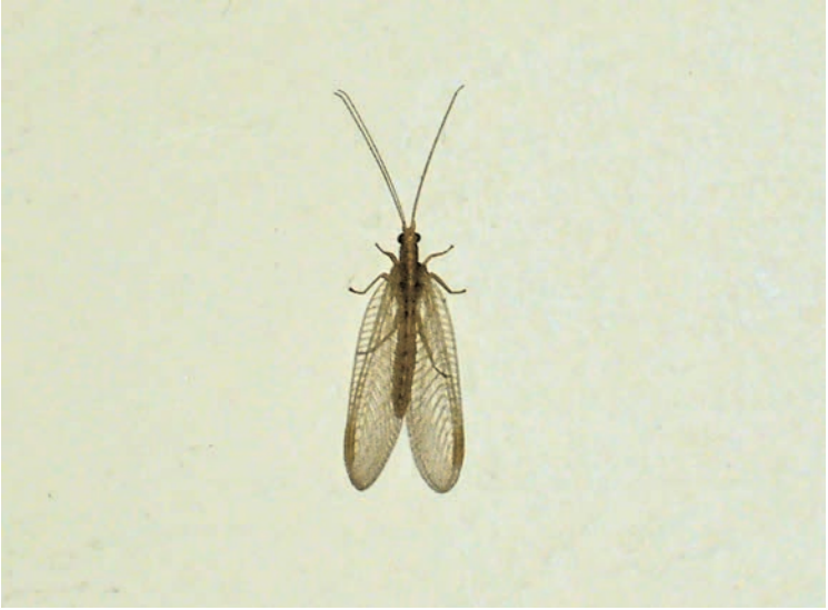
De gaasvlieg (blz. 118)