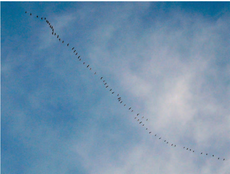
Kraanvogels op 15 november 2007