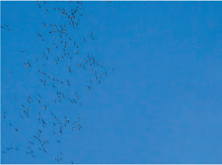
Kraanvogels op 15 november 2007