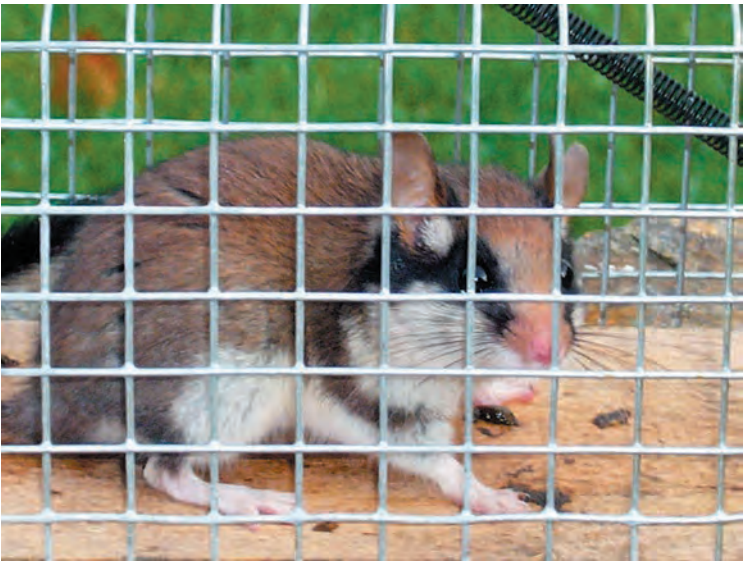
Eikelmuis in "life trap" (blz. 41)