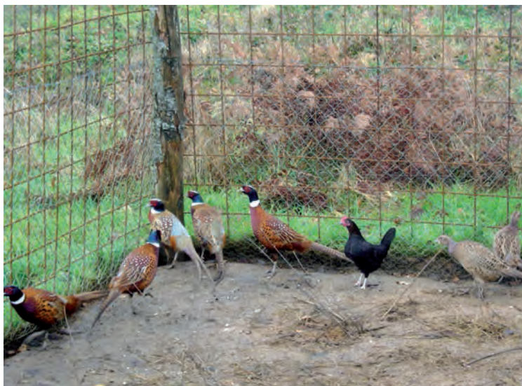
Fazantenkooi (blz. 10)