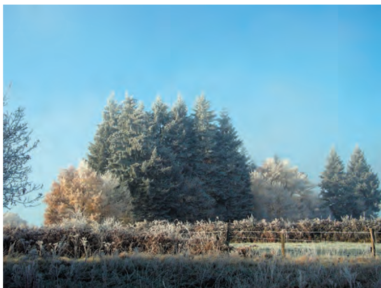
Berijpte natuur op 17 november 2007 (pag. 97)