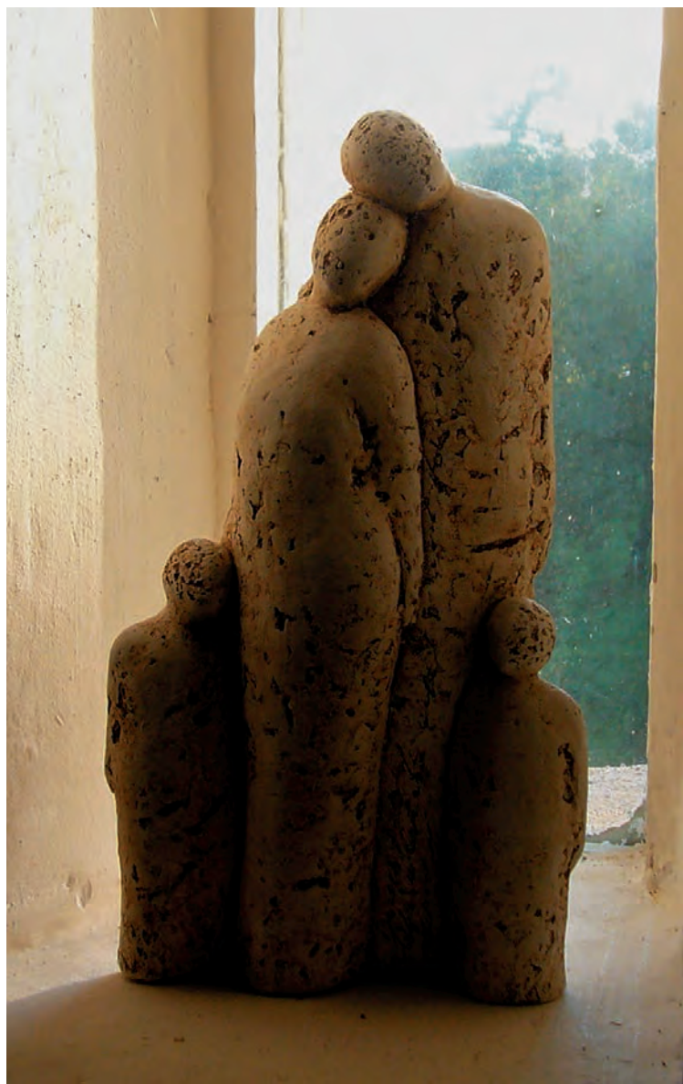
Viereenheid (pag. 130)