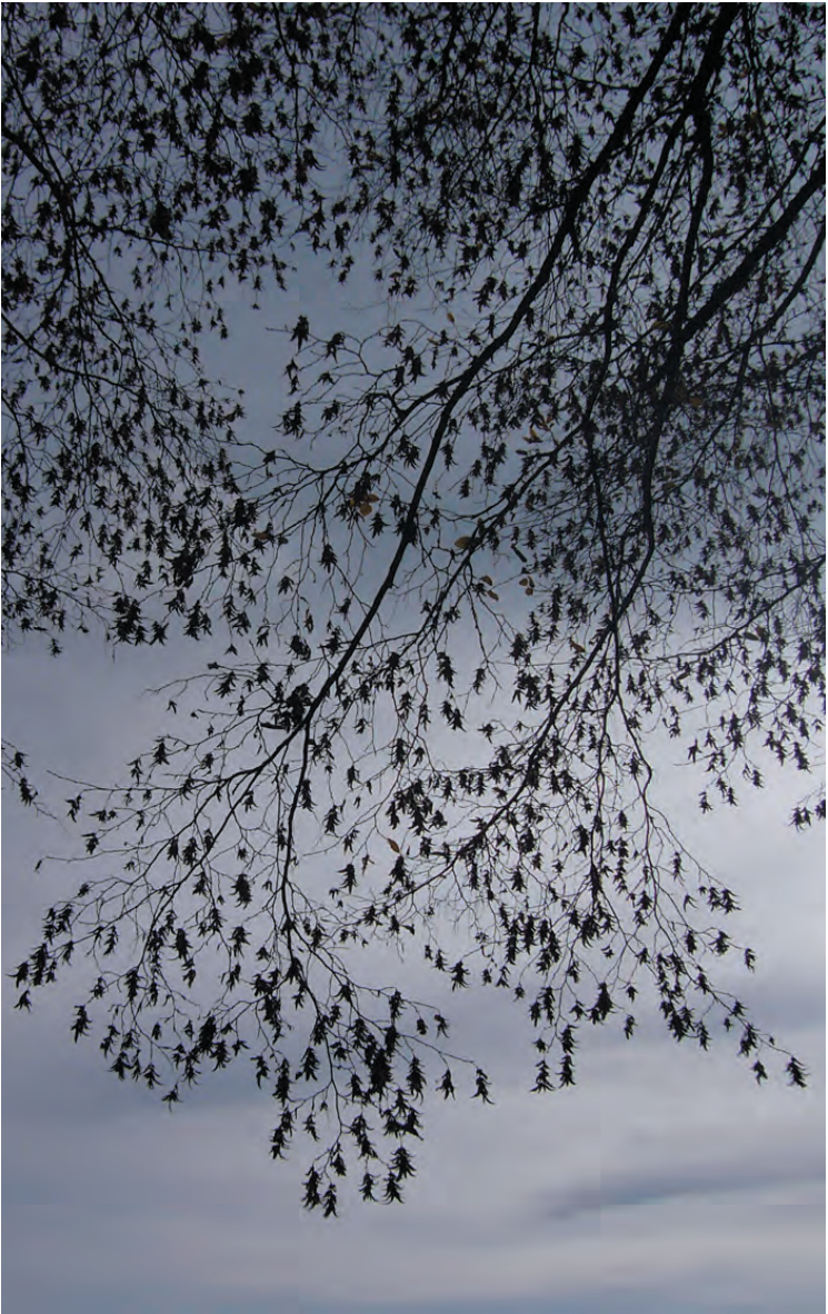
Herfstluchten op 2 december 2007 (blz. 167)