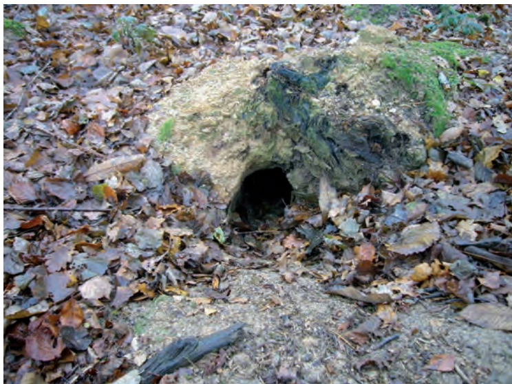
Vossenhol (blz. 111)