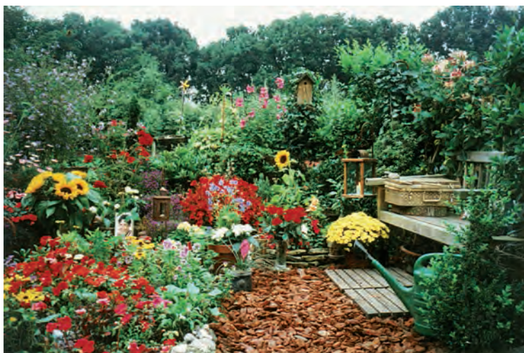
Willems tuintje zomer 2004