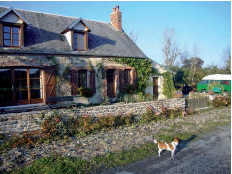
L'Ayant, Dirk en het busje, november 2007