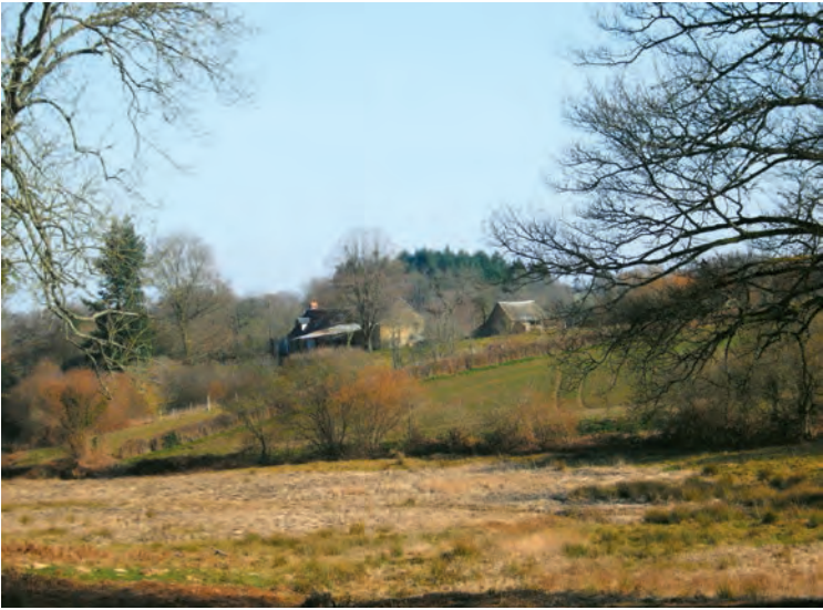
L'Ayant, november 2007 (blz. 11)